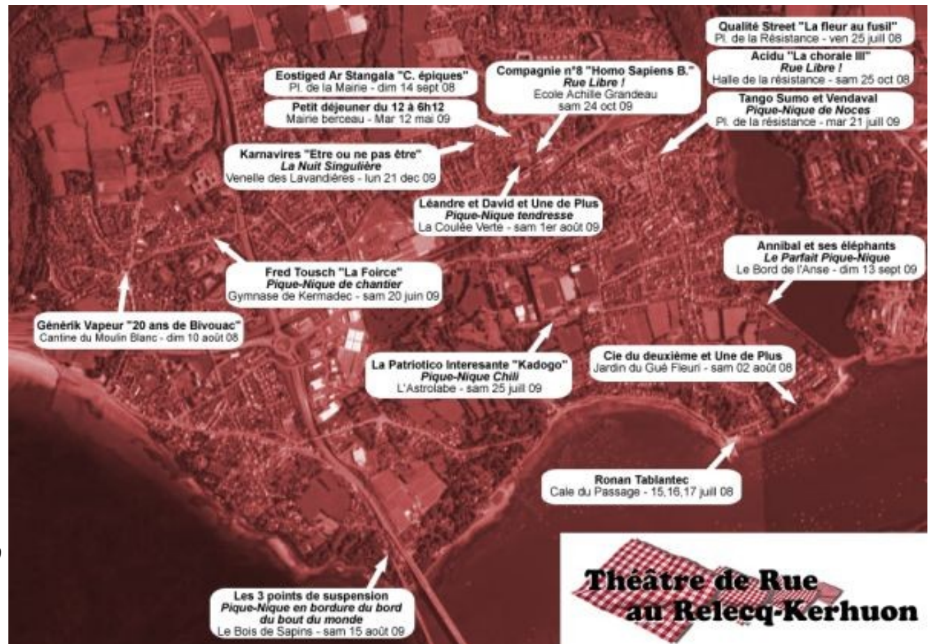
Au fil des rendez-vous 2008 et 2009

Cet été, un réveil républicain et 5 Pique-Niques Kerhorres sont proposés dans des lieux insolites et remarquables de la Ville. Autant d'occasions de partager en famille, entre collègues ou entre amis des émotions artistiques dans l'espace public.