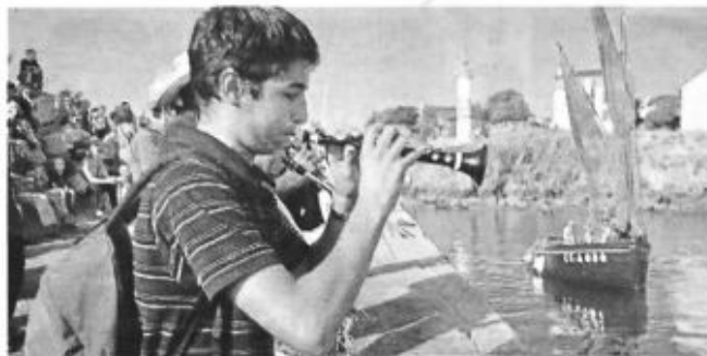
Un spectacle très original. Une première pour le festival des Rias.

« C'est à bâbord qu'on chante, qu'on chante... » « C'est à tribord qu'on chante, qu'on chante... » Tout le monde connaît cette ritournelle populaire. On l'a tous joyeusement fredonné un soir de fête ou lors d'un voyage en autocar quand nous étions adolescents. À Clohars-Carnoët, hier soir, ils ont fait plus ou moins la même chose dans le port de Doélan, mais avec des instruments de musique.