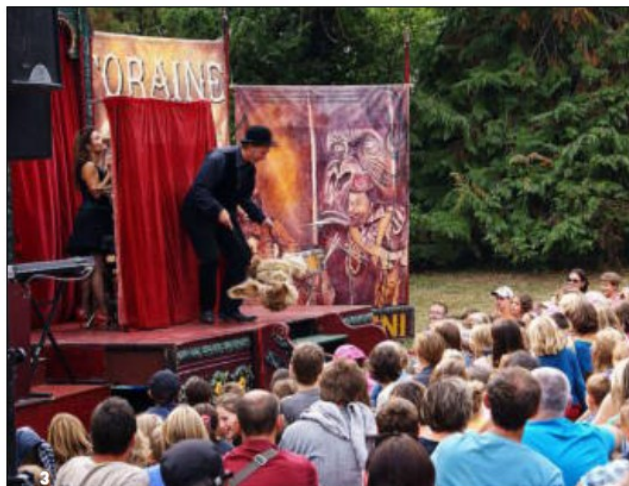
1. Une odyssée complètement déjantée et pleine d'humour a été racontée, samedi soir, sur la rive droite de Doëlan par la compagnie « Les Trois points de suspension ».