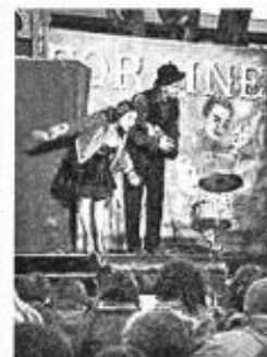
L'illustre Famille Burattini: T'as d'beaux yeux tu sais Carabosse. Dimanche 5 à Riec, Chapelle de Trémor.

Dimanche 5, chapelle de Trémor à 16 h 16 : L'illustre Famille Burattini: T'as d'beaux yeux tu sais Carabosse. Du théâtre forain. Ne vous inquiétez pas, vous pouvez confier vos enfants à Burattini avec l'esprit tranquille car sa famille se charge de leur apprendre la vie à ces « sales mômes »: l'alcoolisme, le machisme, les CRS, le racisme... Autant de thèmes expliqués aux plus petits. Le seul marionnettiste au monde qui n'aime pas les enfants (dixit l'intéressé) sait si bien les captiver. Et aussi: goûter et petite restauration. A vol d'oiseaux de Manou Martinet (conte tout public); démonstration de hip-hop.