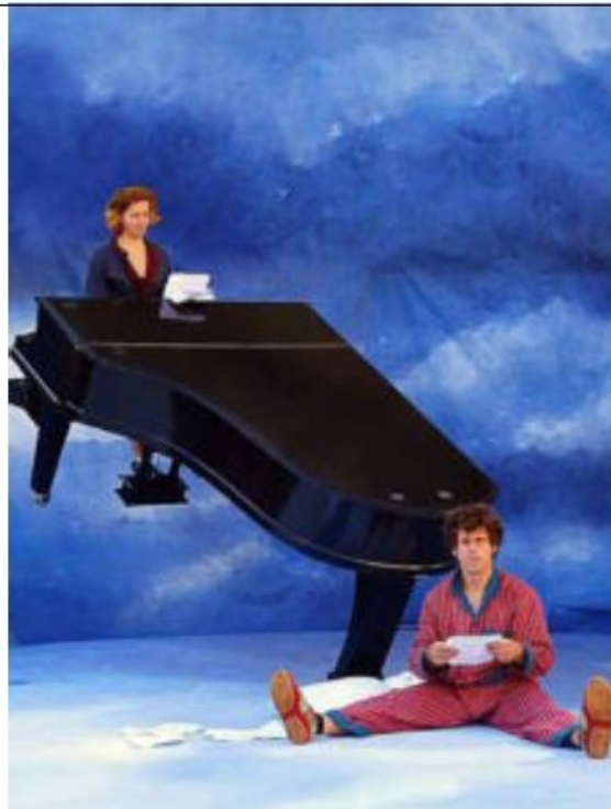
La compagnie belge, « D'Irque et Fien », présentera un spectacle de 60 minutes baptisé « Carrousel des Moutons ».

La deuxième édition du Festival des Rias, qui associe trois communes du littoral, aura lieu vendredi, samedi et dimanche. Fil conducteur : le théâtre de rue.