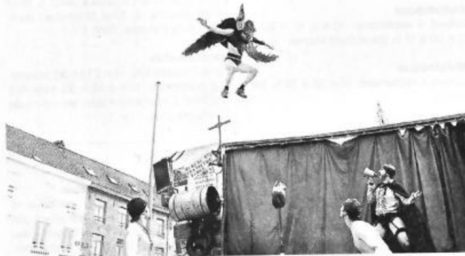
Du théâtre de rue pour le Festival des rias, à Doélan

L'association War Raok Kloar proposera buvette et restauration et le prolongement de la soirée par une scène musicale avec Ronan Alone et Tapataperçu.