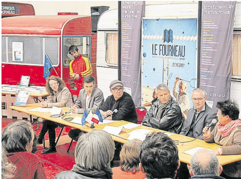
Le programme Zepa 2 s'étendra jusqu'à fin 2014. Il a notamment pour objectif d'accroître les échanges entre artistes et populations et de développer le travail avec les universités.

Le second axe de travail visera à favoriser les parcours de compagnies d'arts de la rue sur les territoires en multipliant les échanges avec les populations. « Pour ce faire, nous chercherons à impliquer les artistes anglais en France et les artistes français en Angleterre, les populations locales et nos principaux