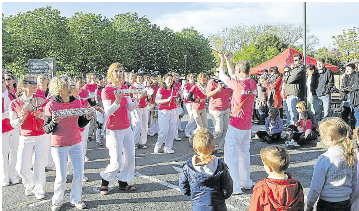
Unidos Da Bagunça : le groupe de percussions brésiliennes donne le ton de la soirée.

Les Desdemoiselles ont remplacé au pied levé - et c'est le cas de le dire -, la première compagnie programmée, suite à la blessure d'un artiste. Elfes dans les airs, apparence déjantée, multitude de balots de vêtements et grand portique