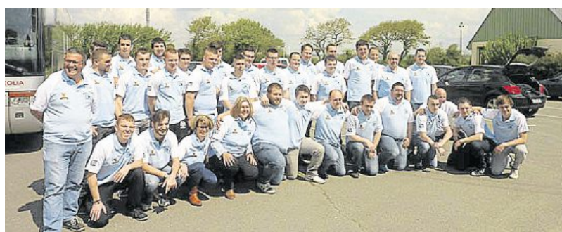
Les rugbymen avant le départ Outre-Manche.

Une délégation du Pac rugby est allée à Minehead, en Angleterre, ce week-end pour remettre en jeu le challenge entre les équipes seniors, challenge remporté, il y a deux ans par le Pac. Ces rencontres qui perpétuent l'amitié entre les deux clubs restent des moments inoubliables pour les participants. Comme chacun le sait, pas de match amical pour les Anglais, un match est un match et il