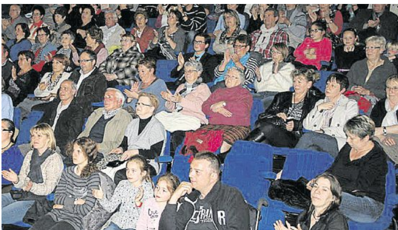
Le groupe des Jamasics (Guitares et chansons) a fait salle comble, vendredi.

Cent soixante-dix spectateurs ont applaudi, vendredi 17 mai, le groupe des Jamasics à l'Agora.