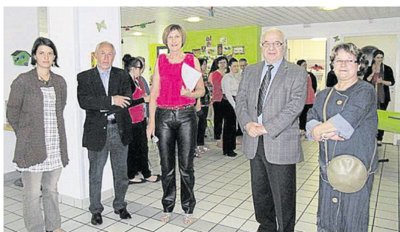
Les responsables de l'établissement et les élus ont adressé quelques mots aux résidents.