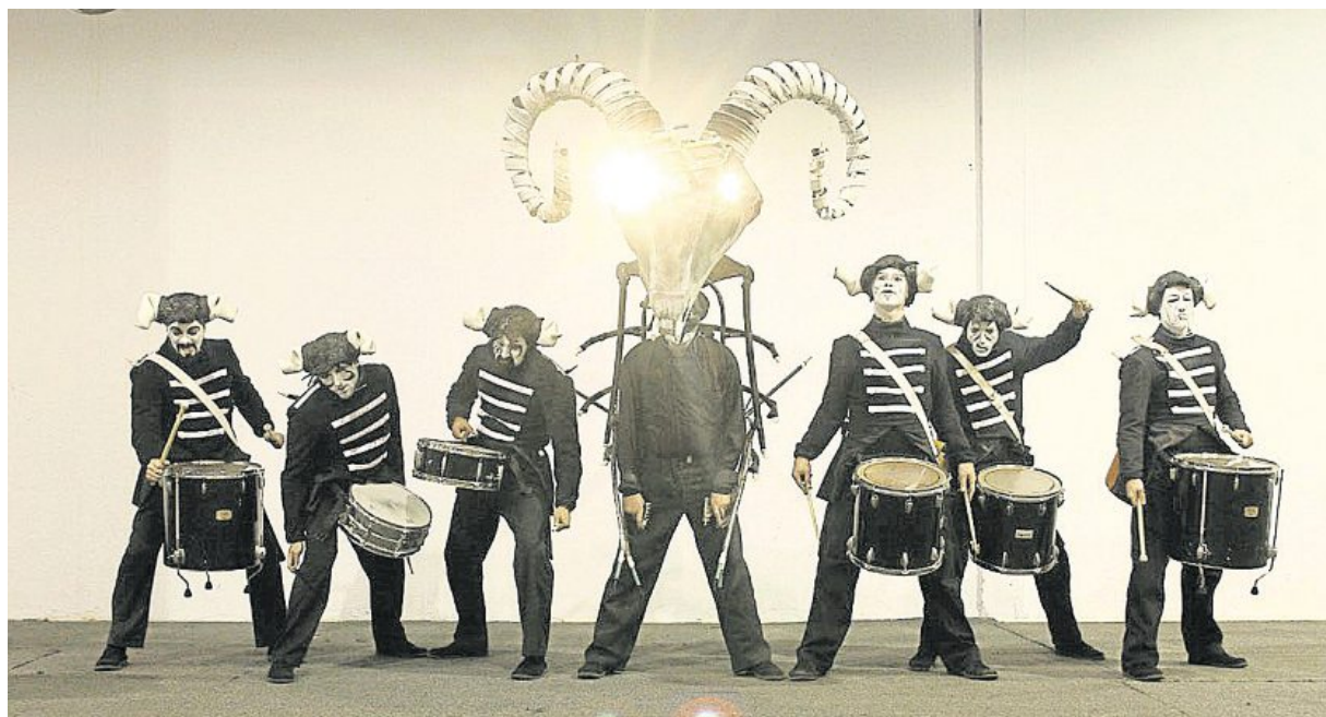
Les Tambours de Feu de la compagnie basque Deabru Beltzak.

À 21 h 03, deux spectacles se dérouleront en simultané : La grève du Crime (théâtre de rue déambulatoire), et L'Oca , spectacle acrobatique semi-déambulatoire. À 22 h 22, ce sera au tour des Tambours de Feu d'envahir la place de l'Europe avec un spectacle pyrotechnique et déambulatoire. Ils entraîneront la foule jusqu'au stade Kroas-Kenan, où le final promet d'être magique : un lâcher de