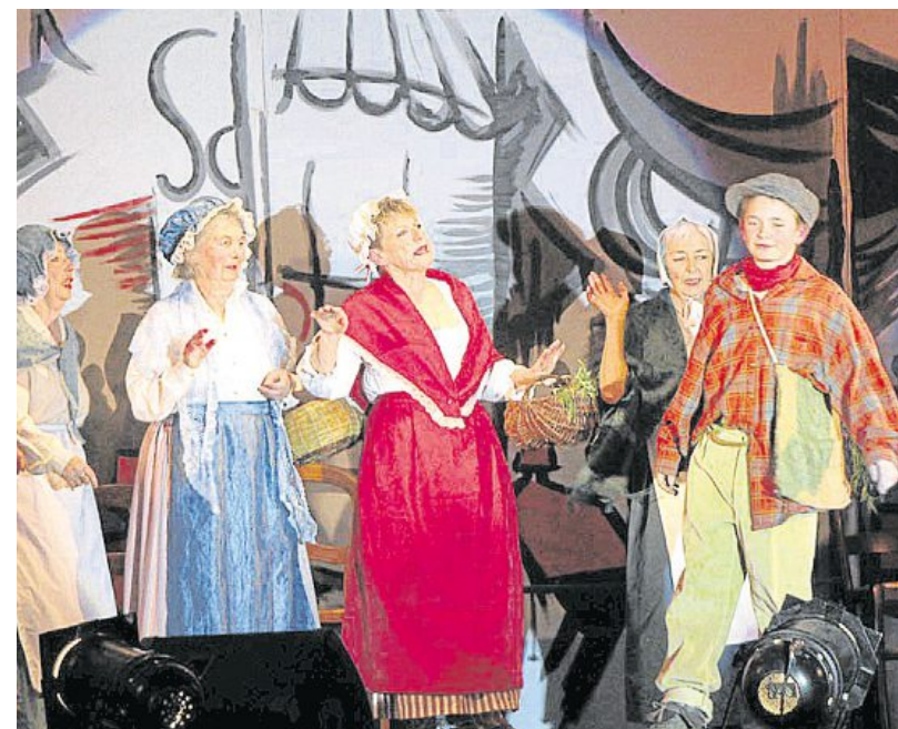
Un spectacle de qualité avec des chansons reprises par les spectateurs.

Samedi, à la maison du temps libre, l'association pour la sauvegarde du patrimoine maritime du Fret a proposé deux spectacles : le premier à 15 h avec un goûter et le 2 e à 17h, accompagné d'un repas. Ce 25 e spectacle a affiché complet, comme tous les ans.