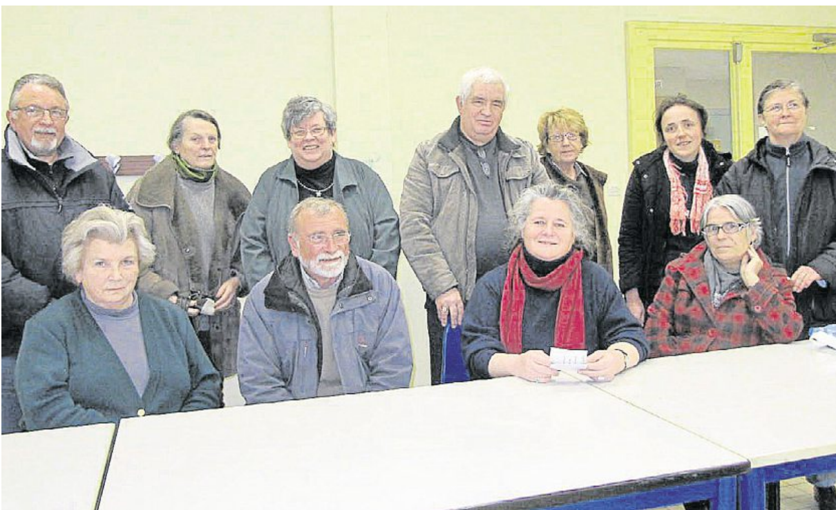
Les bénévoles sont à pied d'œuvre pour préparer le festival.