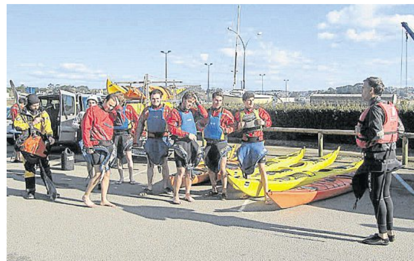
Le groupe de l'école des télécoms.