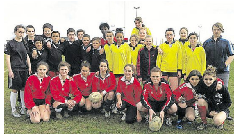
Les trois formations du collège se sont bien comportées mercredi à Saint-Brieuc.

Après avoir composé leur ticket lors des départementaux, en février, les élèves du collège Beg-Avel disputaient mercredi, à Saint-Brieuc, les finales académiques. Trois formations étaient en lice. Les benjamins se sont imposés remportant le titre. De leurs côtés les benjamins ont échoué sur la dernière marche devenant toutefois vice-championnes de Bretagne. Les minimes filles ont remporté la médaille de bronze. Dans le même temps, les minimes de la section sportive de rugby étaient à Chartres pour disputer trois matches face à Nantes, Dijon et Chinon. Au terme de ce tournoi, les Carhaisiens