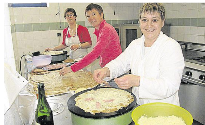
Jeudi à l'initiative de la cantinière et pour faire plaisir aux enfants, un repas crêpes était servi. C'était en fait une chandeleur avec du retard et une animation très appréciée.