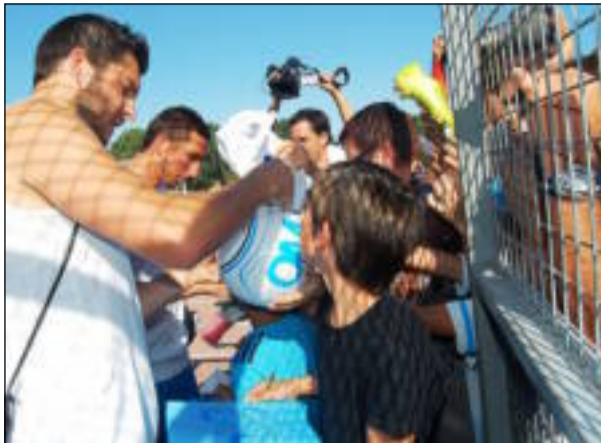
André-Pierre Gignac, en pleine séance de dédicaces.

L'Olympique de Marseille a posé ses valises sur la Presqu'île de Rhuys (56) pour la semaine. Une partie des joueurs est arrivée jeudi. Ils seront rejoints aujourd'hui par les internationaux. Les joueurs s'entraînent en public tous les soirs, au parc des sports de Sarzeau, de 17 h à 18 h 30, en présence de centaines de supporters. Ils logent dans un grand hôtel de la presqu'île et bénéficient des meilleures conditions de