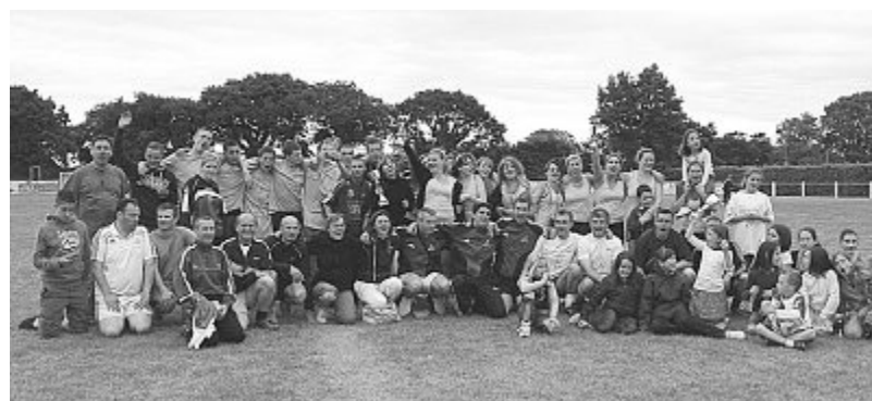
Les équipes finalistes.

Samedi s'est déroulé au stade Jo-Le Bris le traditionnel tournoi de football de Saint-Urfold organisé par l'association des parents d'élèves de l'école Saint-Yves-Notre-Dame.