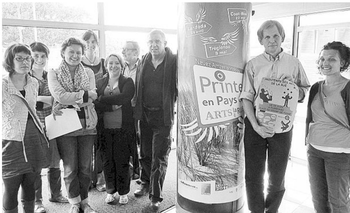
Les différents partenaires de la dernière étape du Printemps des arts de la rue se sont réunis à Plabennec mercredi dernier.

Les associations communales se mobilisent également en organisant différentes animations. Une randonnée reliant Le Drennec à Plabennec partira de la mairie à 9 h. Dès 11 h, arrivée de la Brigade des Abers, puis