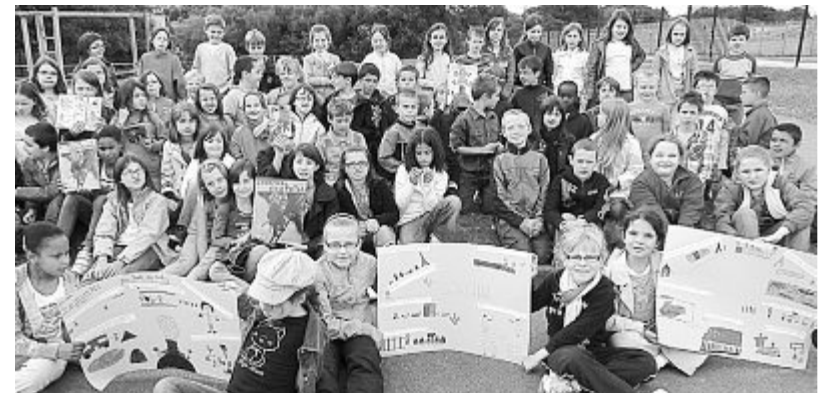
Les élèves de l'école du Lac ont aussi réalisé des travaux liés à ce prix, visibles en ce moment à la bibliothèque.

Le gagnant national qui a été révélé la semaine dernière est Le pompier de Lilliputia , un très bel album également. Les jeunes lecteurs peuvent découvrir ces ouvrages, ainsi que des travaux liés à ce prix réalisés par des élèves de l'école du Lac, à la bibliothèque.