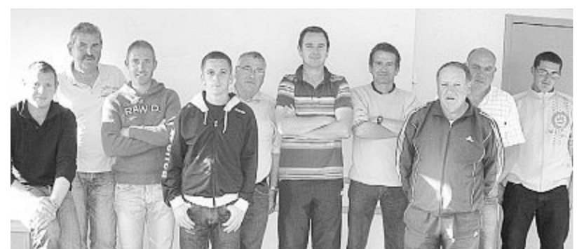
L'équipe du bureau de l'US Saint-Roch, prête pour une nouvelle saison.