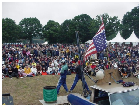
Les Frères Grumaux 2001