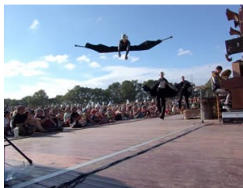
Les 3 points de suspension, Voyage en bordure du bord du bout du monde 2006