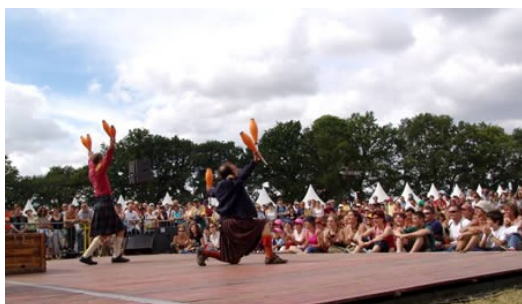
Mic Mac Compagnie, Ne me kilt pas ! 2005