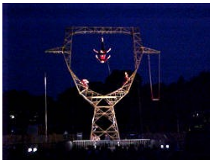
Les Noctambules, Le spectre du Minotaure 2000