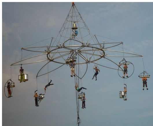
Transe express, Les Maudits sonnants 2002