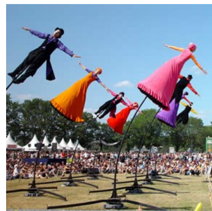
Strange Fruit, The Field 2004