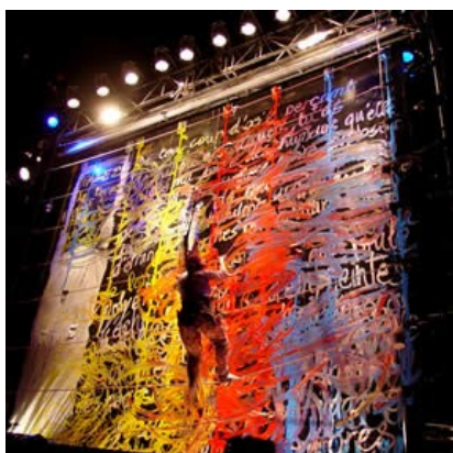
Amoros et Augustin, 360° 2003