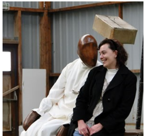
Une de Plus, Pont d'Avril 2010