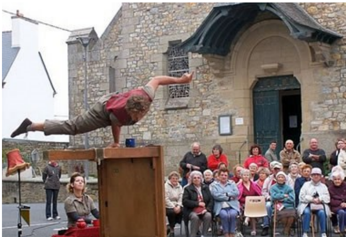
D'irque et Fien, Pont d'octobre 2009

Pont d'Avril à Camaret Kitschnette - On passe à table Samedi 2 avril 2011 à 16h16