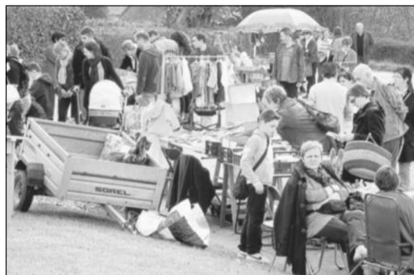
Une sympathique manifestation qui a pu se dérouler, pour le plaisir des participants, sous un beau soleil.

Dès le matin, un vide-greniers et jardins a attiré un nombre conséquent d'amateurs qui ont pu déambuler et faire des affaires autour des linéaires disposés en plein air, sous un magnifique soleil, du côté de la salle polyvalente.