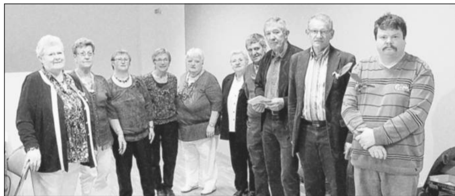
L'équipe organisatrice, en compagnie du maire de la commune, s'est réjoui du bon déroulement de la compétition.

Le troisième prix, avec 38 points, à l'équipe Salou, de Kernouës ; à la quatrième place, avec