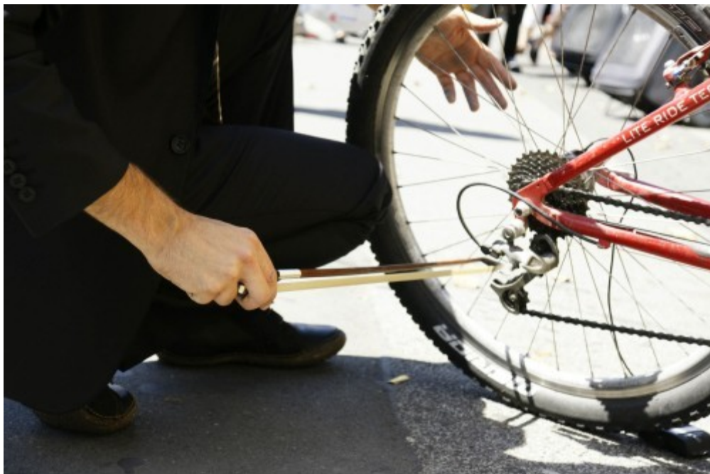
La Strada-Die Organisation

DÉAMBULATION SONORE - AUBERVILLIERS (93)